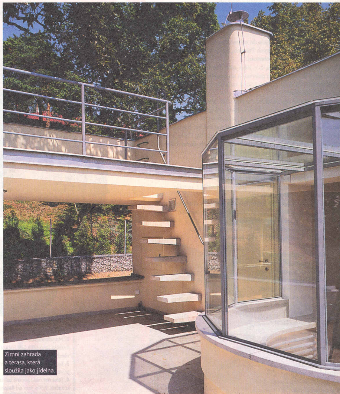
Zimní zahrada a terasa, která sloužila jako jídelna.

Architektce se podařilo vytvořit příjemný základ pro nové bydlení, které se dá dále zařídit podle Fričova hesla „Peníze jsou od toho, aby se utrácely“ a kde, jak tvrdí sousedé, může „šampaňské téct proudem“.