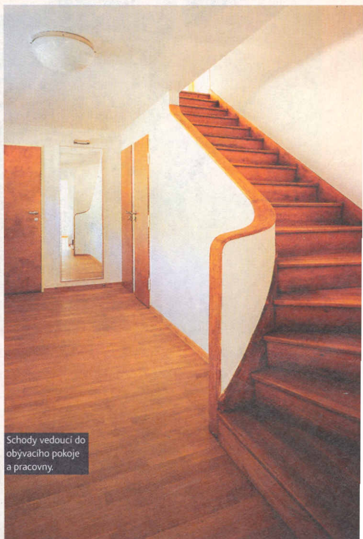
Schody vedoucí do obývacího pokoje a pracovny.