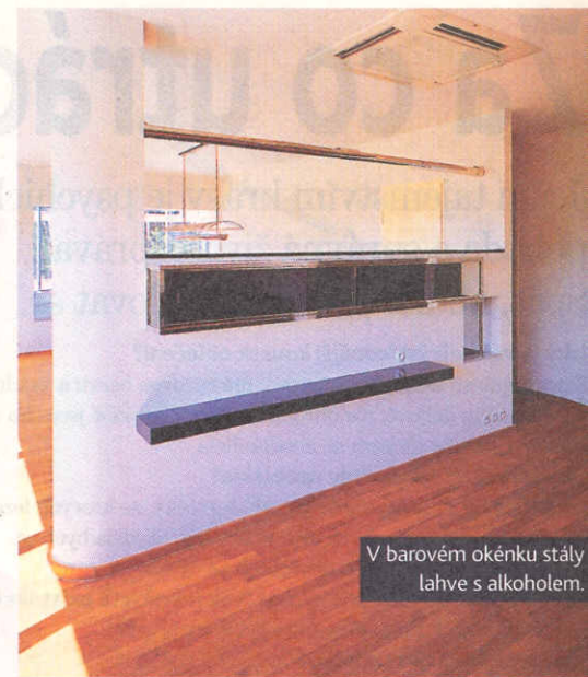
V barovém okénku stály lahve s alkoholem.

„Peníze jsou od toho, aby se utrácely a aby teklo šampaňské proudem.“