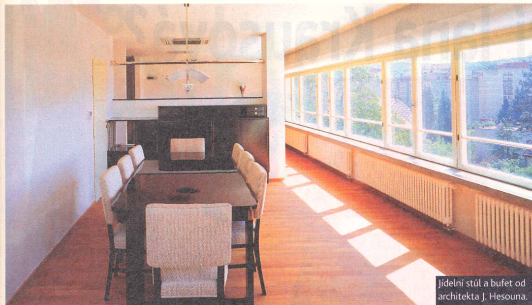
Jídelní stůl a bufet od architekta J. Hesouna.